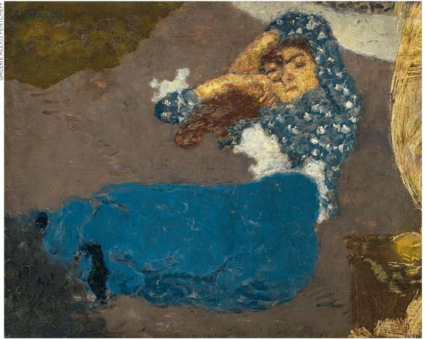
GALERIE ALEXIS PENTCHEFF

ASBL. Une identité mise particulièrement en avant pour son 65 e anniversaire à travers la tenue d'une vente caritative qui remplace les traditionnels invités d'honneur et met aux enchères pendant toute la durée de la foire cinq blocs de béton provenant du Mur de Berlin au profit de cinq associations belges actives dans les domaines de la préservation du patrimoine mais aussi de la recherche contre le cancer et l'intégration des personnes handicapées. Achetés en 2018 à une entreprise de travaux publics berlinoise